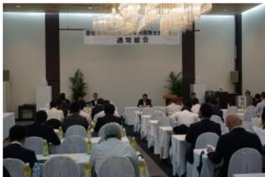
県中小企業団体中央会青年部協議会総会

愛媛県中小企業団体中央会は、県内協同組合の指導などを行う団体ですが、青年部活動にも力を入れており、当組合青年部もその活動目的に賛同するとともに各種事業に参画しています。