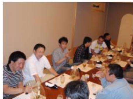
和やかな雰囲気の中、 委員会メンバーの意思疎通が図られます。

会員は3委員会のいずれかに所属しますが、毎年所属する委員会は変わります。このため各委員長は、事業を円滑に進めるために、事業開始の前に委員の招集を行い、事業の方向性などを決めるための打合せ、並びに顔合わせ会を行っています。尚、この席には会長並びに副会長も同席頂きます。