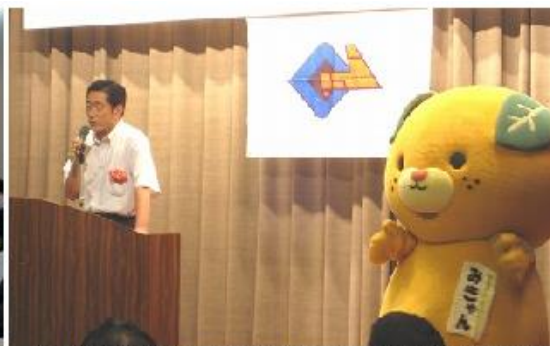
全国中小企業青年中央会通常総会(愛媛県)知事挨拶